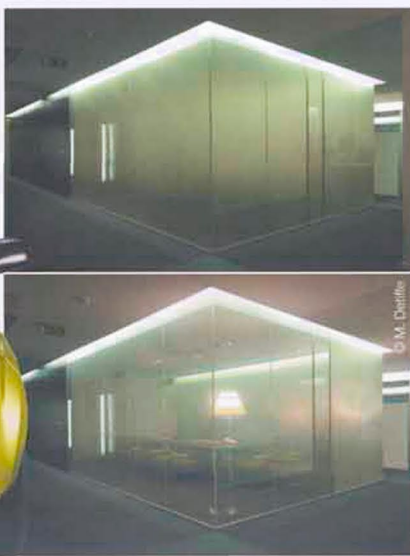
"Priva-Lite" permet de privatiser l'espace, une technologie labellisée Quantum Glass TM.