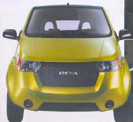
La Reva électrique, disponible à l'été 2010.